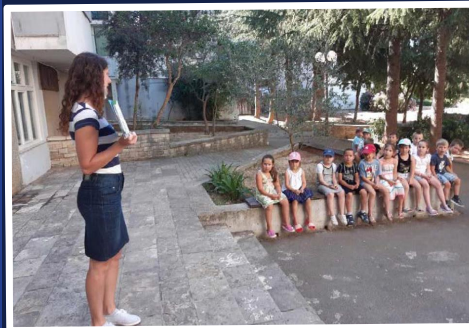
Čitajmo izvan okvira

Zaključak: Uslijed epidemije virusa COVID-19 Knjižnica se morala okrenuti virtualnim kanalima, društvenim mrežama i aktivnostima u dvorištu. Iako je vrijeme boravka u prostoru Knjižnice ograničeno, a niz programa odgođen, Knjižnica je uspjela zadržati svoje čitatelje i održati kontakt s mladim i starijim korisnicima.