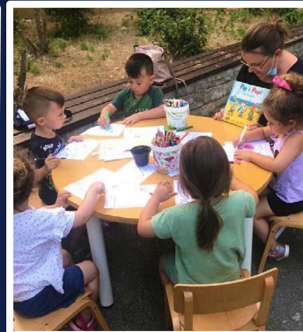
Čitajmo izvan okvira