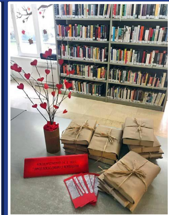
Spoj naslijepo s knjigom povodom Valentinova (za odrasle)