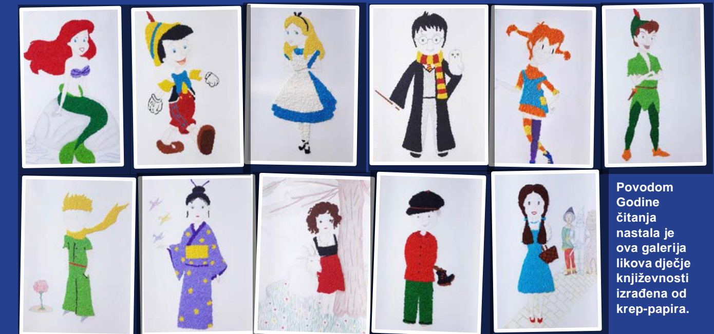
Povodom Godine čitanja nastala je ova galerija likova dječje književnosti izrađena od krep-papira.