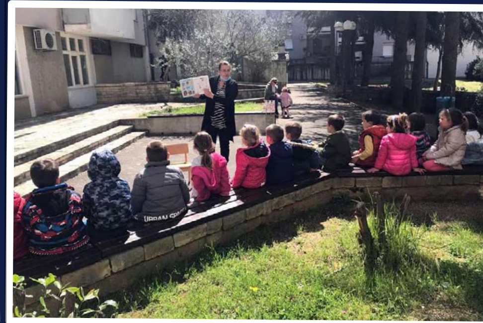
Čitajmo izvan okvira