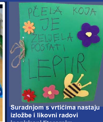
Suradnjom s vrtićima nastaju izložbe i likovni radovi inspirirani literarnim naslovima ili